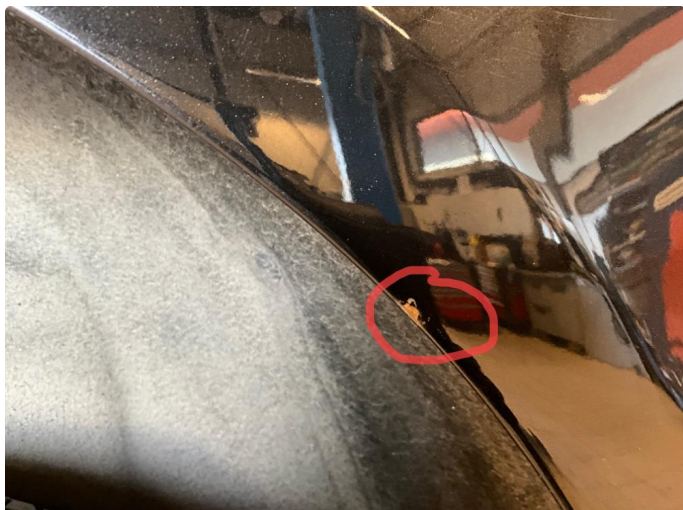
1.1 Rust i fals på høyre bakdør.