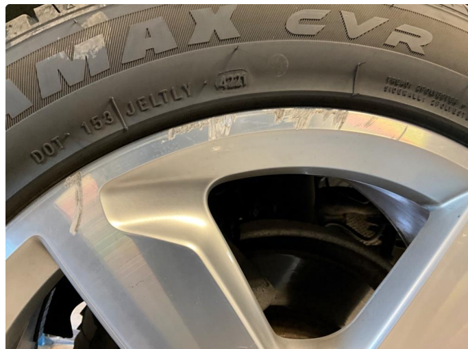
1.2 Begge felger på venstre side er kantkjørt.