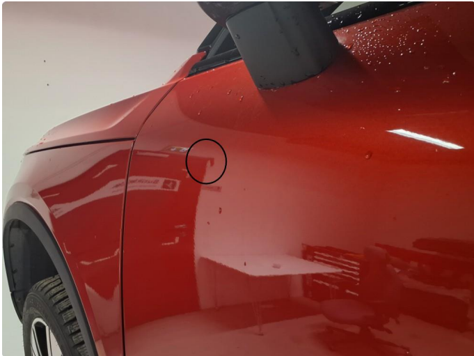
1.2 Liten p-bulk venstre dør foran