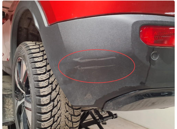
1.3 Noe merker på bakfanger