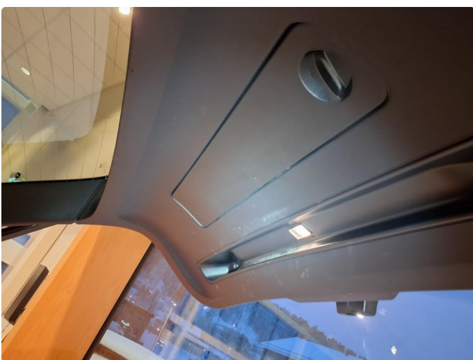
2.1 Bruksmerker etter utstyr