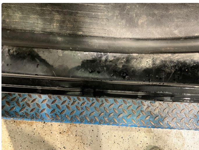
1.4 Slitt innsteg