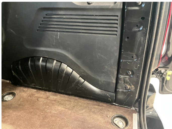
2.1 Generelt mye bulker/riper