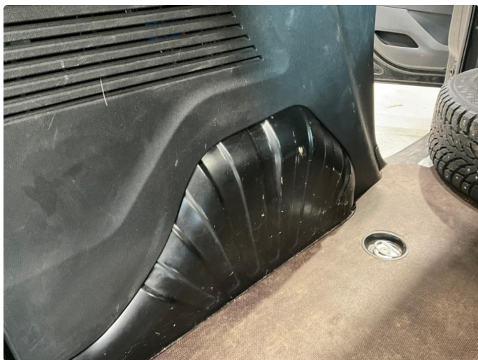
2.1 Generelt mye bulker/riper