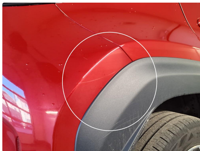
1.8 Ripe på støtfanger.