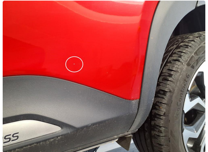
1.2 Steinsprut på dør.