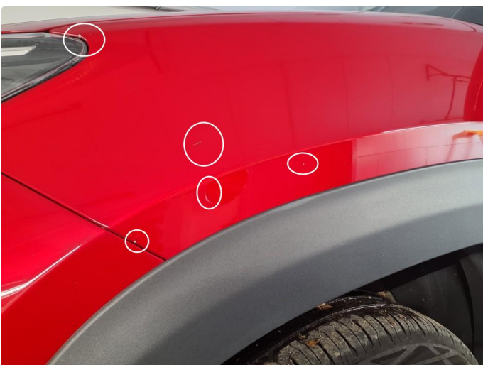
1.5 Steinsprut på begge skjermer foran.