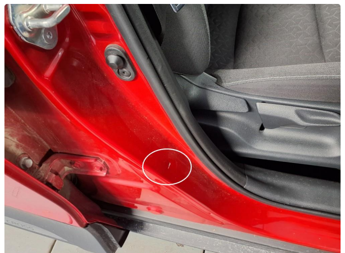
1.6 Bulk med lakkskade.