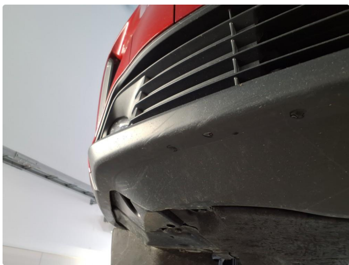
1.9 Skrubbskader underkant.