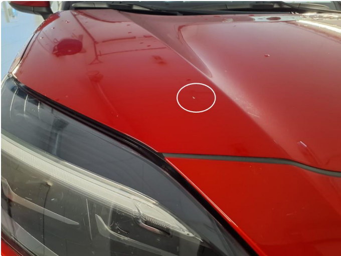
1.1 Steinsprut på panser.