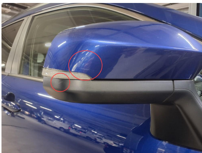
1.5 Riper på speilhus.