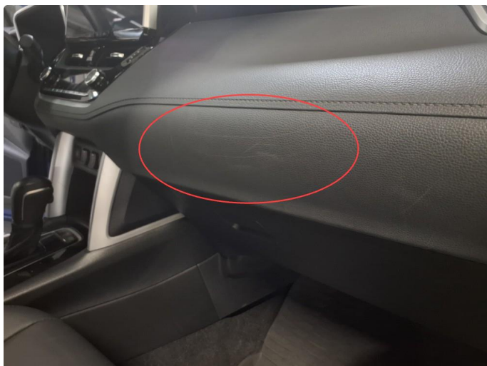
3.1 Små skrubbsår på dashbord.