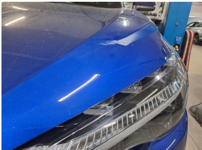
1.1 Steinsprut på panser.