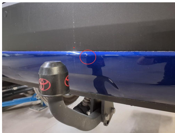
1.8 Ripe/hakk på støtfanger bak.