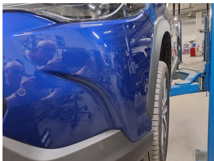
1.6 Steinsprut på støtfanger.