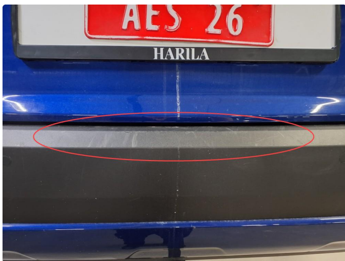
1.7 Riper på plastdel på støtfanger bak.