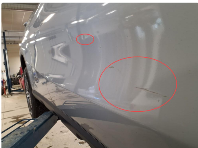
1.3 Lakkskade og liten bulk