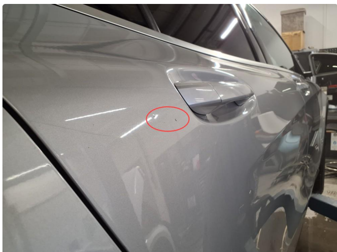
1.1 Liten bulk med lakkskade