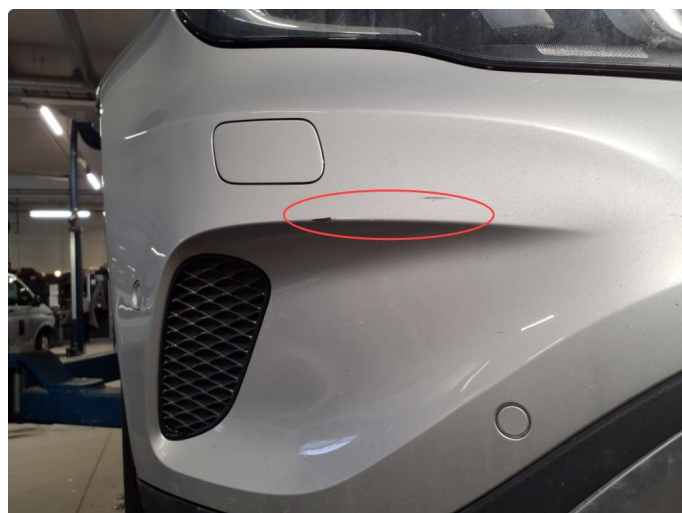
1.5 Noen riper i støtfanger