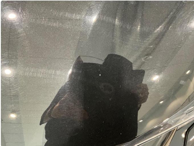
1.1 Noe steinsprut på panser.