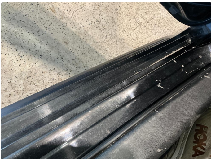
1.4 Riper og slitasje på innsteg. Venstre foran.