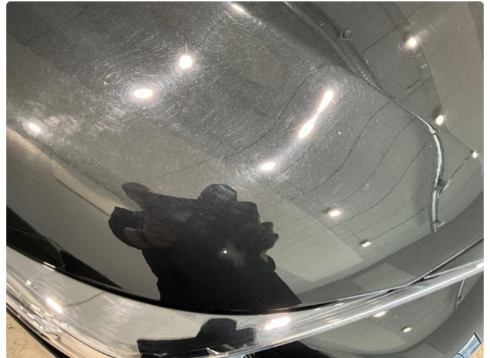
1.1 Noe steinsprut på panser.