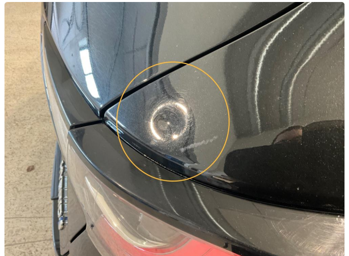
1.3 Bulk i skjerm over baklykt. Høyre bak.