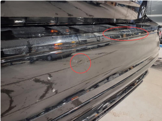
1.3 Liten bulk med lakkskade