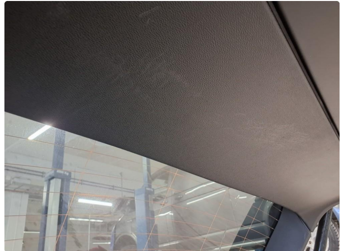
2.1 Merker etter utstyr bakluke