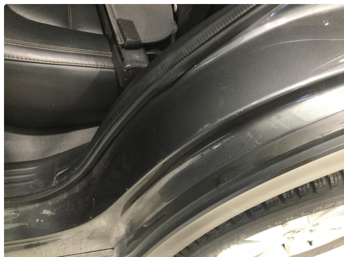
1.2 Der finnes noen riper og småbulker i døråpning