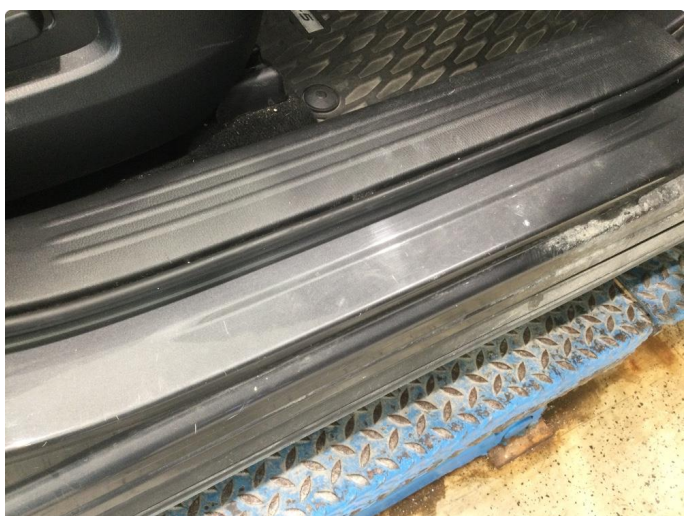
1.2 Der finnes noen riper og småbulker i døråpning