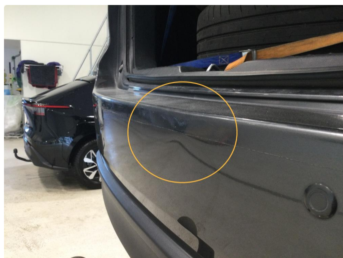
1.3 Der er liten bulk på bakfanger