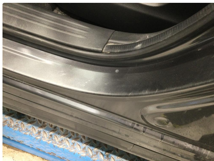
1.2 Der finnes noen riper og småbulker i døråpning