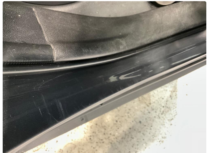
1.4 Slitt innsteg