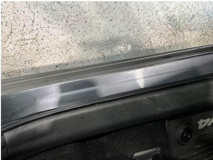
1.3 Slitt innsteg.