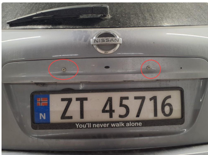
1.2 Deksel/list skrudd fast