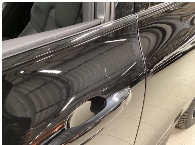
1.2 Noe merker ved dørhåndtak venstre foran