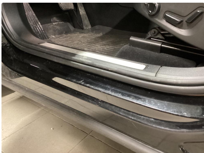
1.3 Noe merker på terskel venstre foran