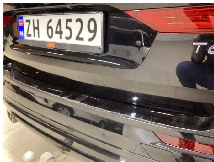
1.5 Noe slitasje på bakfanger