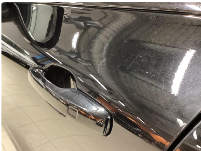
1.2 Noe merker ved dørhåndtak venstre foran