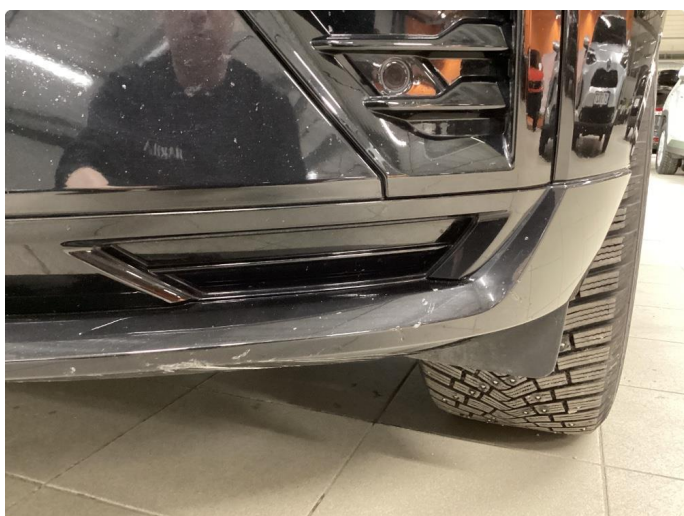
1.4 Noe merke frontfanger venstre foran