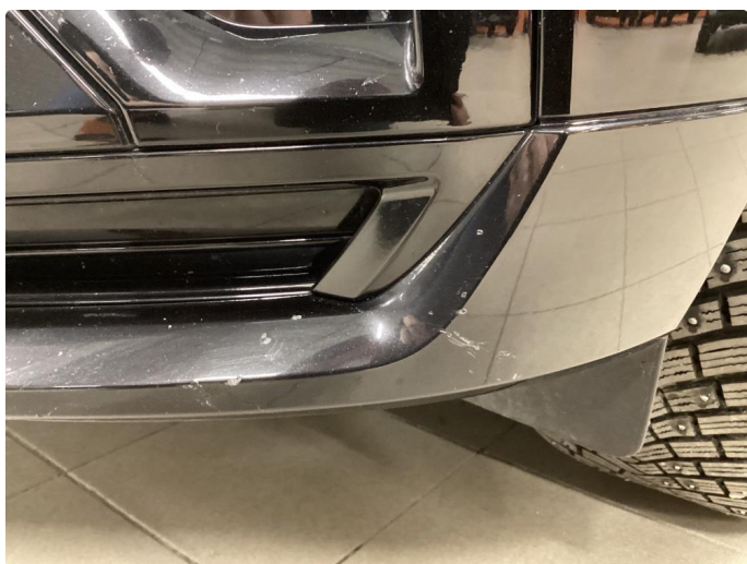
1.4 Noe merke frontfanger venstre foran