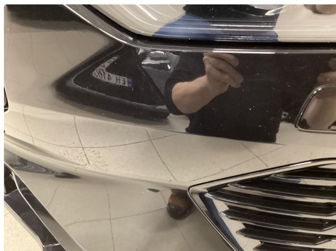
1.4 Noe merke frontfanger venstre foran