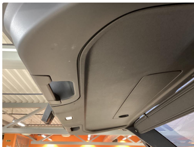
2.1 Noe bruksmerker dørtrekk på bakluke