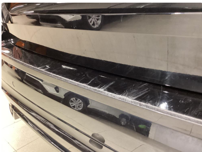
1.5 Noe slitasje på bakfanger