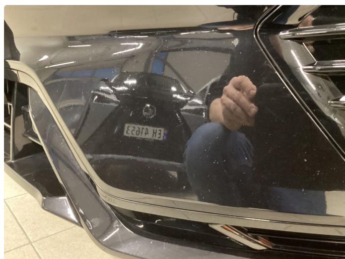
1.4 Noe merke frontfanger venstre foran