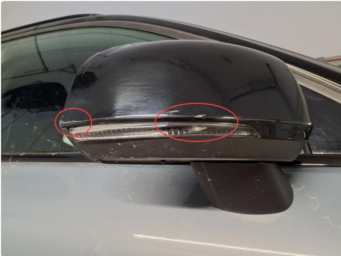
1.1 Riper i deksel