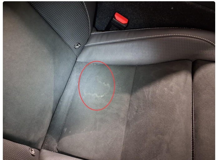
2.1 Bruksmerker i sete