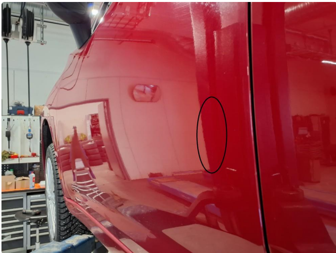
1.1 Liten p-bulk