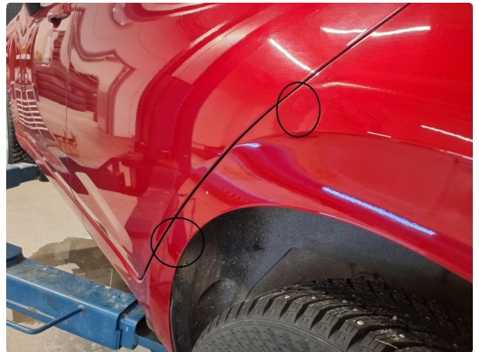
1.2 Liten p-bulk