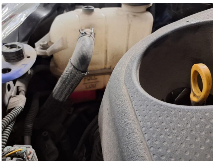
3.1 Kjøleveske under minimum