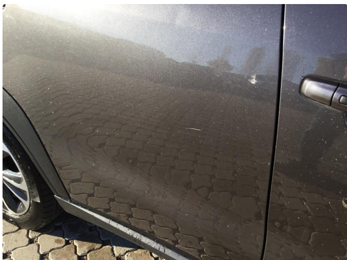
1.1 Ripe ned til grunning