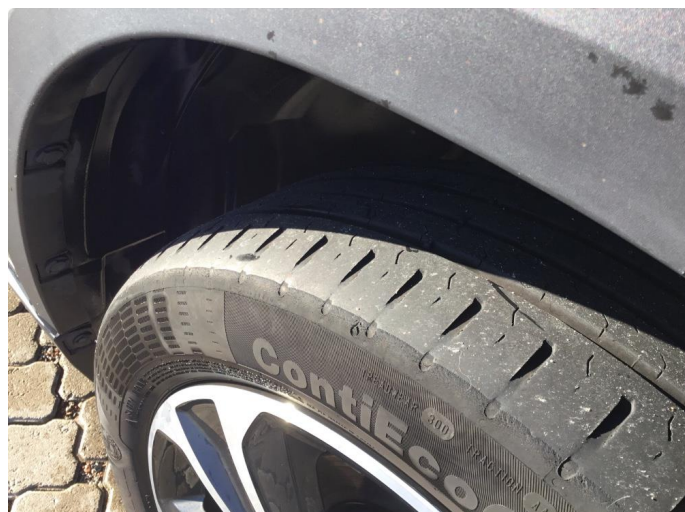
1.2 For liten mønsterdybde sommerdekk