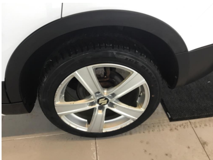
1.2 Korrodering på felg, ikke merkbart