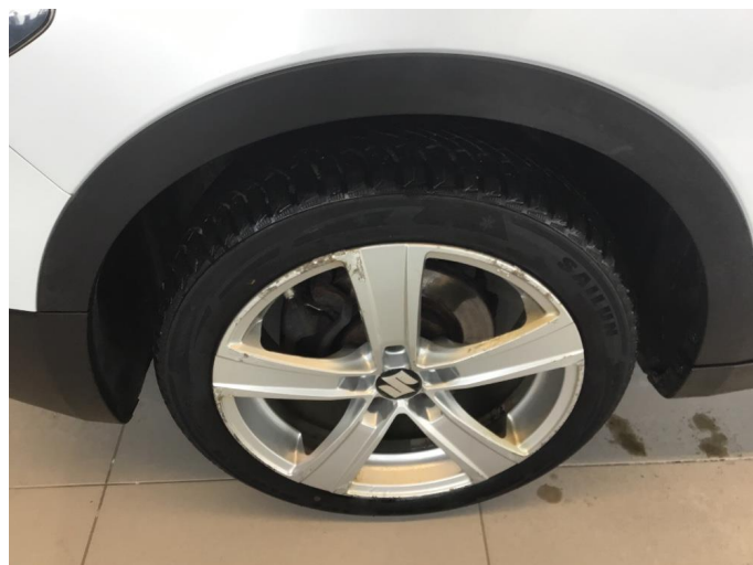
1.2 Korrodering på felg, ikke merkbart