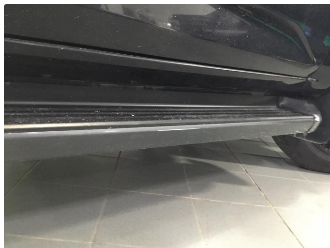
1.2 Noen riper og småbulker