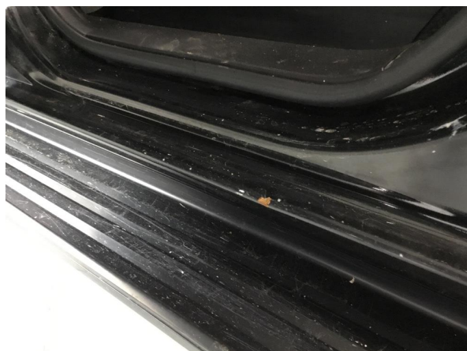
1.2 Noen riper og småbulker