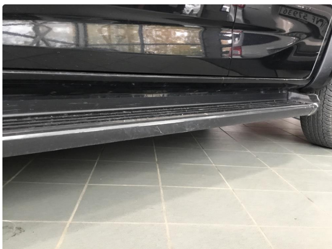
1.2 Noen riper og småbulker