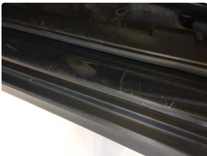
1.3 Riper dør terskel