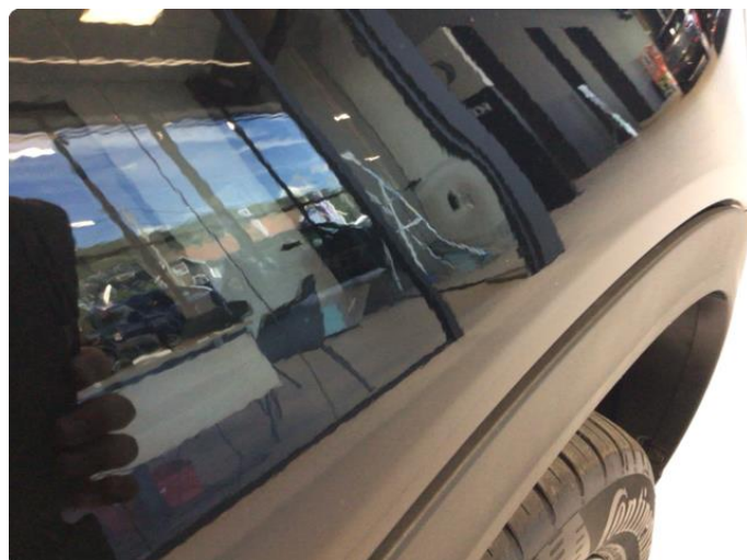
1.2 Liten bulk