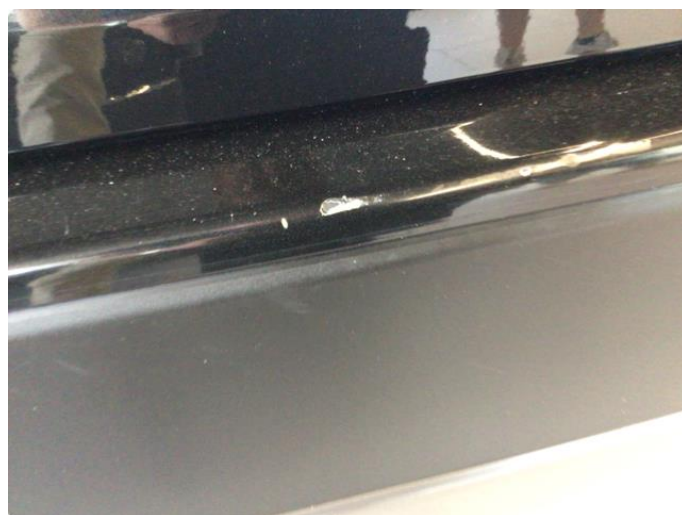
1.4 Liten lakkskade plast