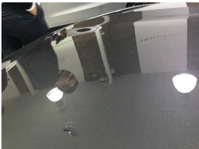
1.1 Flere bulker