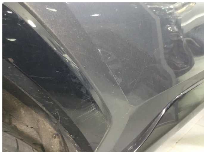
1.2 Ripe ned til grunning