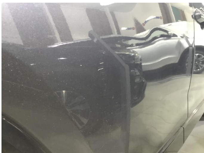
1.2 Ripe ned til grunning