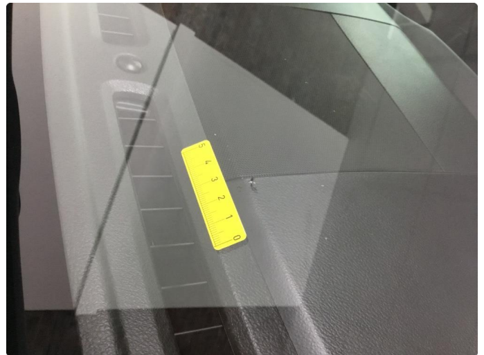
1.2 Steinsprut utenfor synsfelt