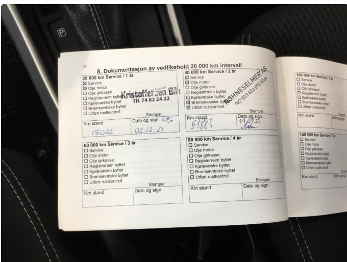
2.1 Service etter bilens intervall ikke fulgt