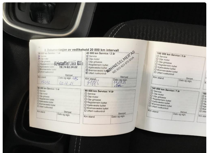
2.2 Mangler tidligere service