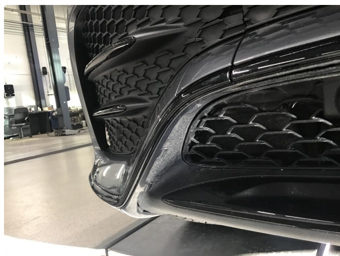
1.4 Øvrige feil