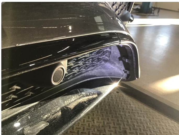
1.4 Øvrige feil