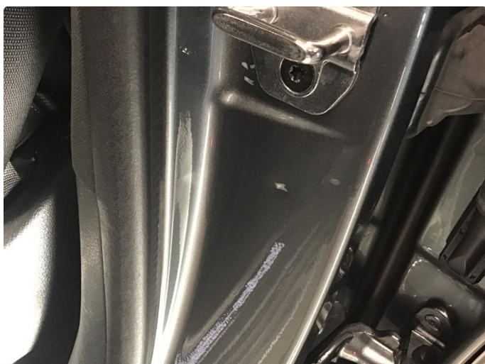
1.2 Bulk(er) med lakkskade