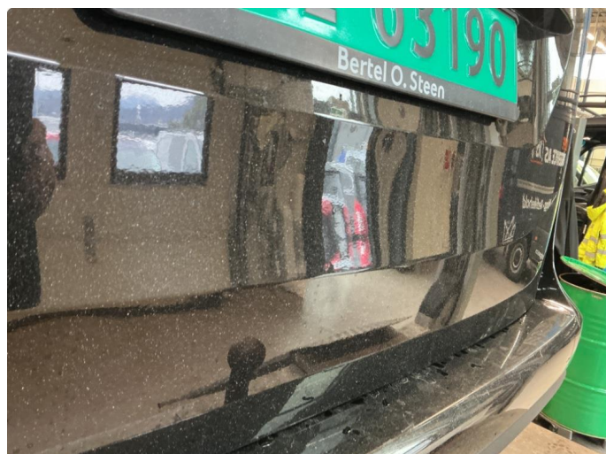
1.2 Bulk med lakkskade