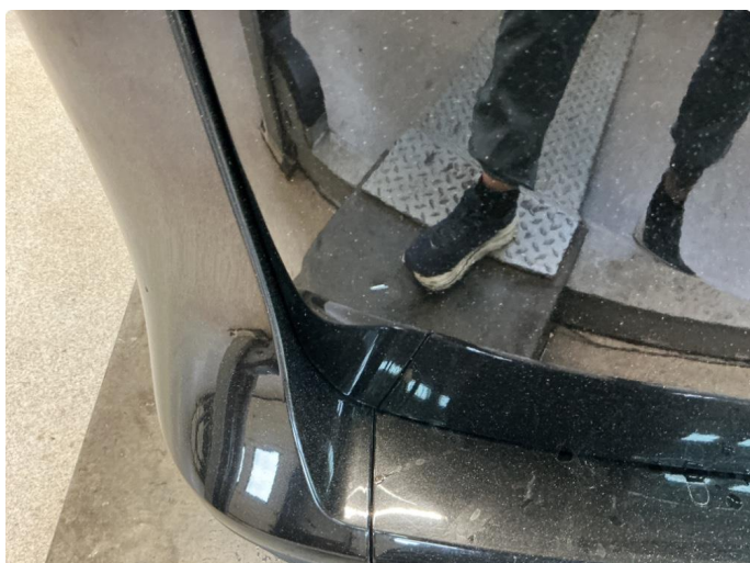
1.2 Bulk med lakkskade