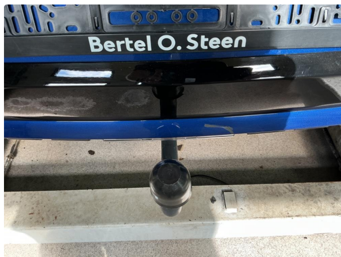
1.4 Ripe(r) ned til grunning