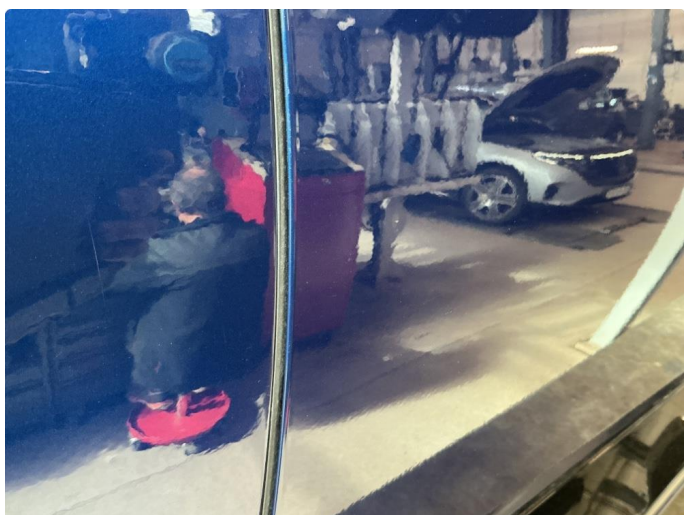
1.3 Bulk med lakkskade