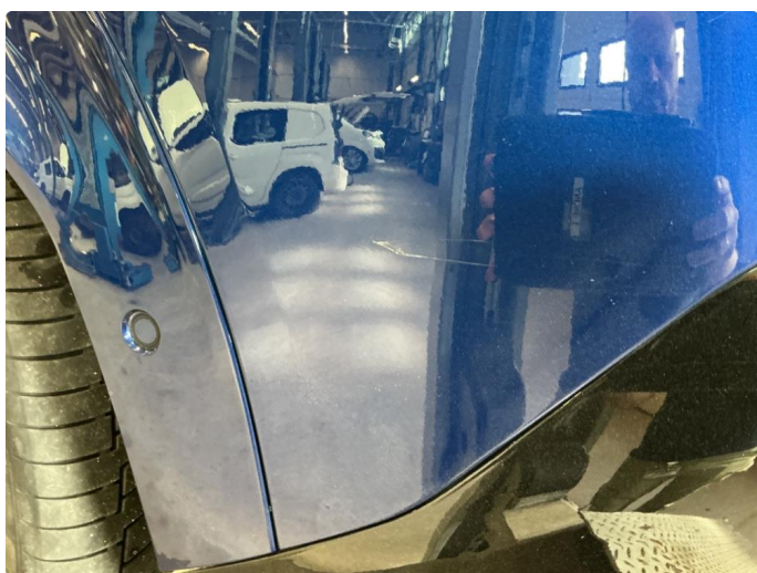
1.4 Ripe(r) ned til grunning