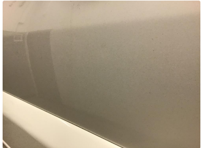
1.1 2 småbulker venstre framdør.