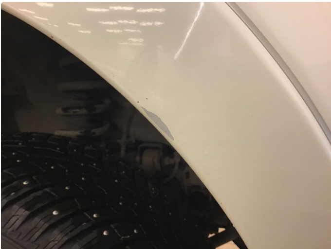
1.2 Liten lakkskade på skjermbredder høyre foran.