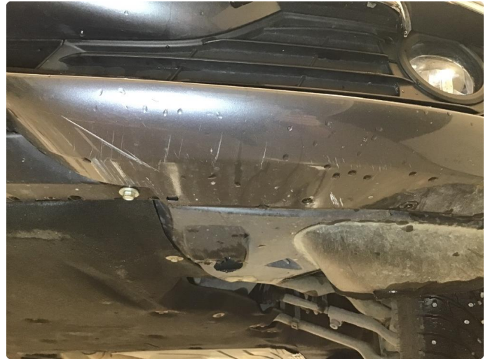
1.1 Skrubbeskader under støtfanger foran.