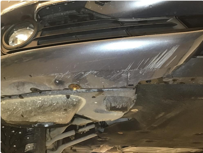
1.1 Skrubbeskader under støtfanger foran.