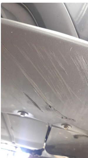
1.3 Lister skadet/mangler