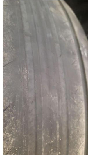
1.2 For liten mønsterdybde sommerdekk