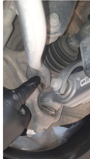
3.1 Slitt casterstagforing