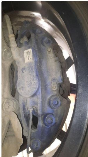
4.1 Slitte kløsser