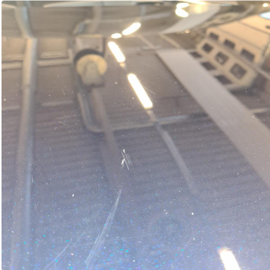
1.1 Noen riper og småbulker i karosseri