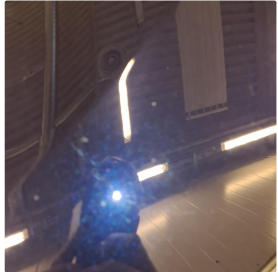
1.1 Noen riper og småbulker i karosseri