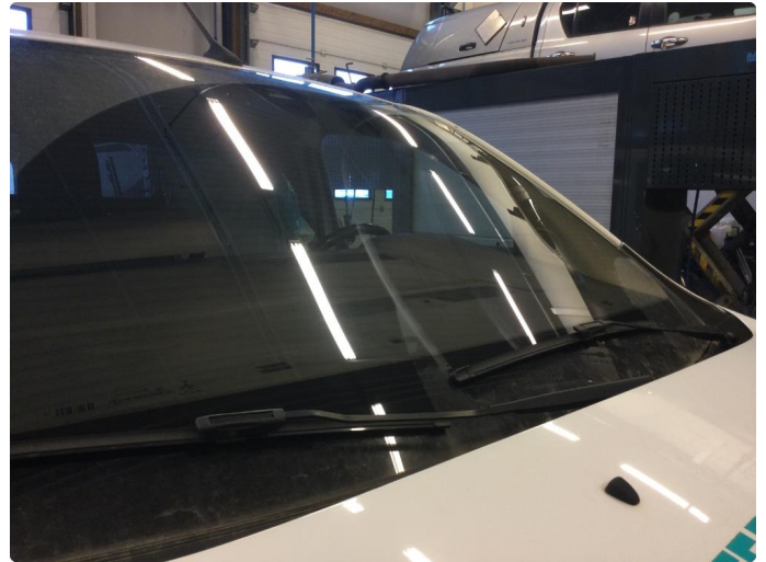
1.5 Sliteriper i synsfelt