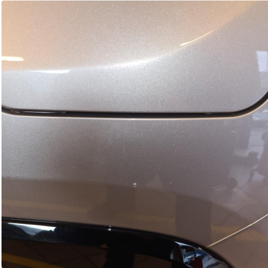
1.1 Noen steinsprang og riper i lakk