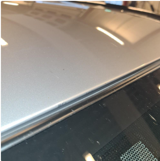
1.1 Noen steinsprang og riper i lakk