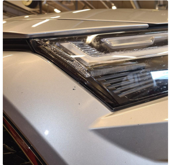
1.1 Noen steinsprang og riper i lakk