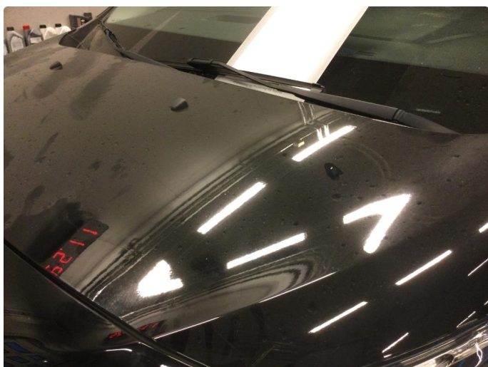
1.1 Er mye hakk, riper og sltsje rundt om på bil.