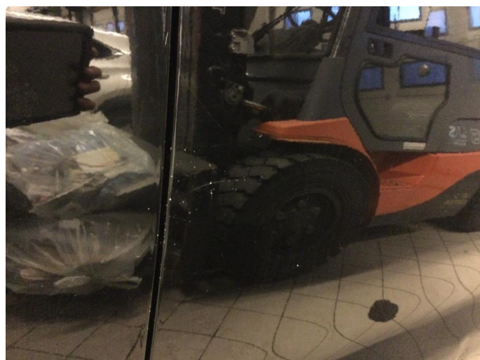
1.1 Er mye hakk, riper og sltsje rundt om på bil.