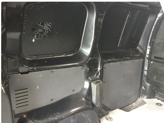
2.1 Generelt mye bulker/riper