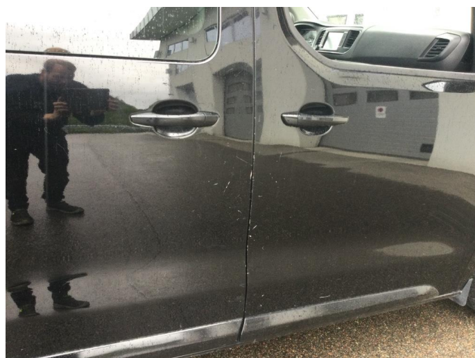
1.2 Noen riper og småbulker