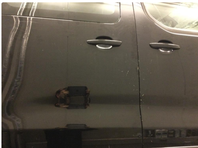
1.1 Er mye hakk, riper og sltsje rundt om på bil.