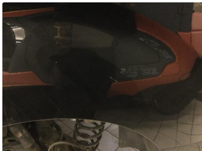
1.1 Er mye hakk, riper og sltsje rundt om på bil.