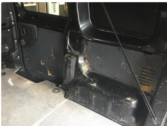
2.1 Generelt mye bulker/riper