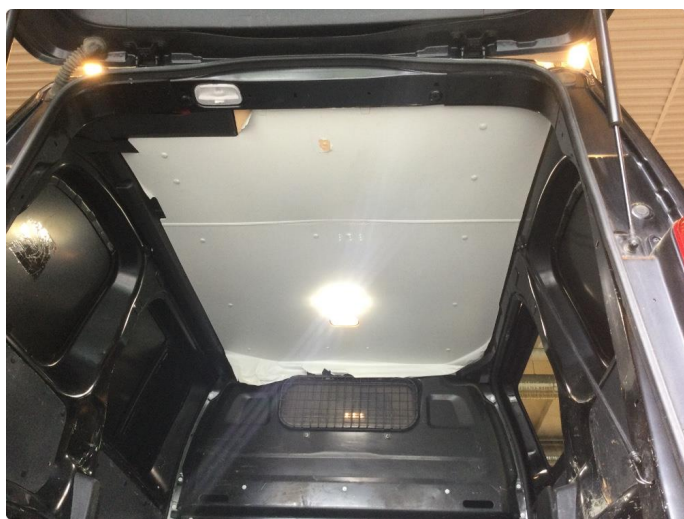
2.1 Generelt mye bulker/riper