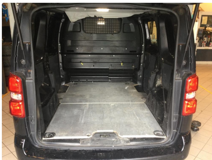
2.1 Generelt mye bulker/riper