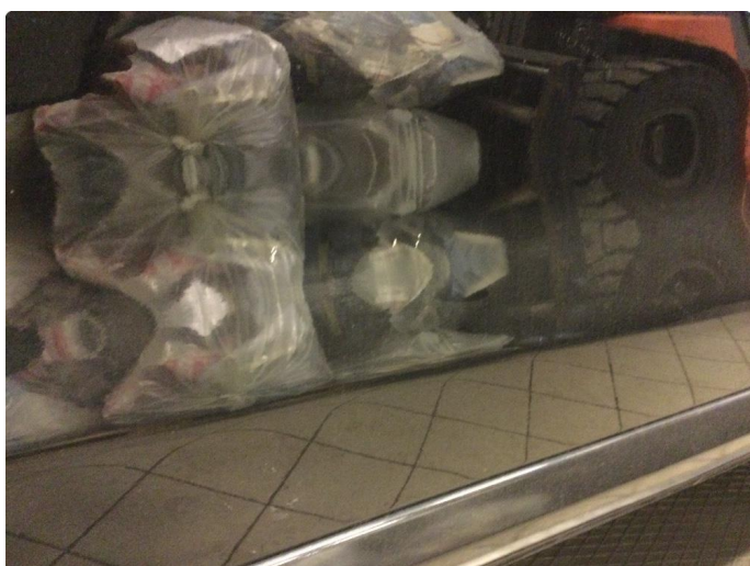
1.1 Er mye hakk, riper og sltsje rundt om på bil.