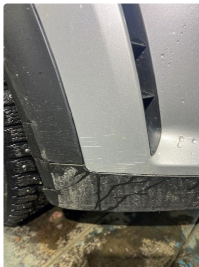
1.2 Ripe(r) ned til grunning