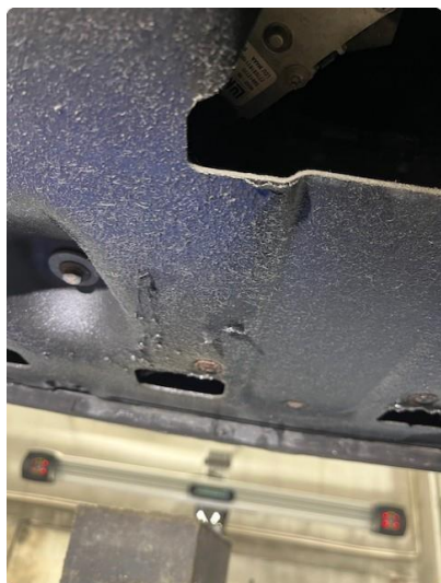
1.1 Beskyttelsesplate skadet/mangler