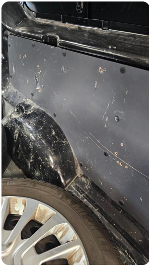
1.1 Deksler skadet/mangler Unormal slitasje - mye riper og hull i deksel