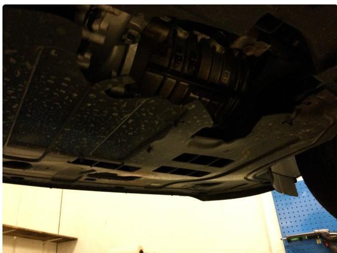
1.2 Beskyttelsesplate skadet/mangler