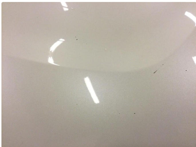
1.3 Noe steinsprut med rust