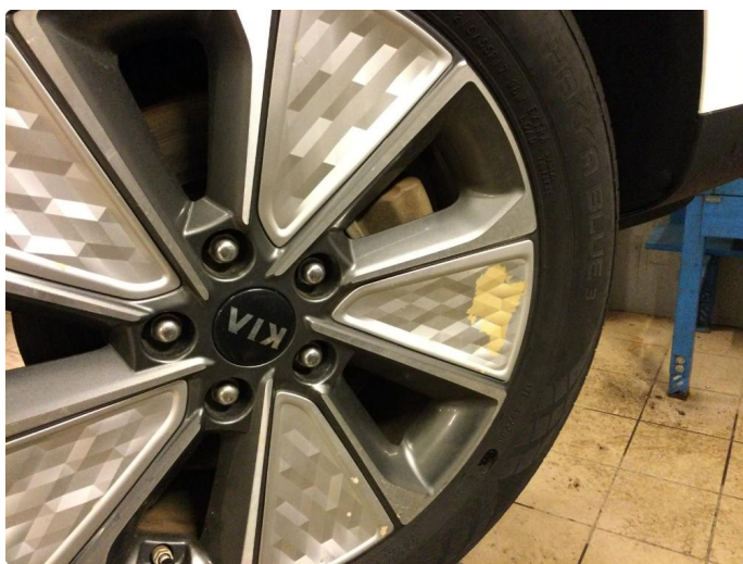
1.4 Øvrige feil