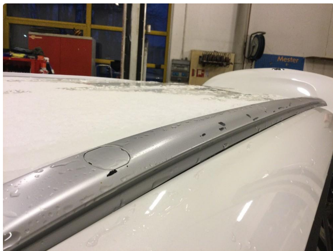
1.7 Lakk flasser