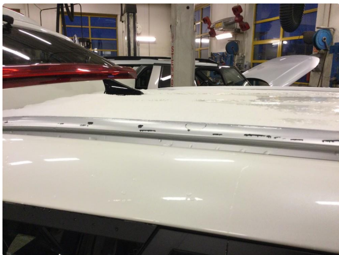
1.7 Lakk flasser