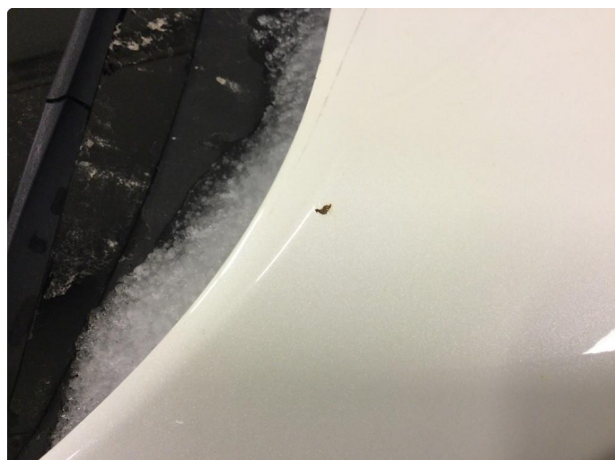
1.3 Noe steinsprut med rust