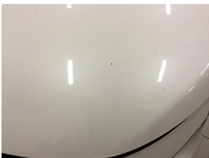
1.3 Noe steinsprut med rust