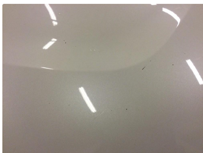
1.3 Noe steinsprut med rust