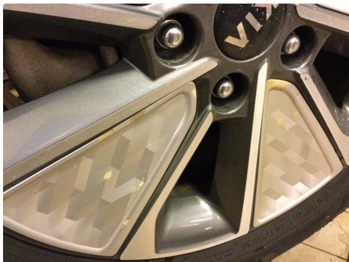
1.4 Øvrige feil