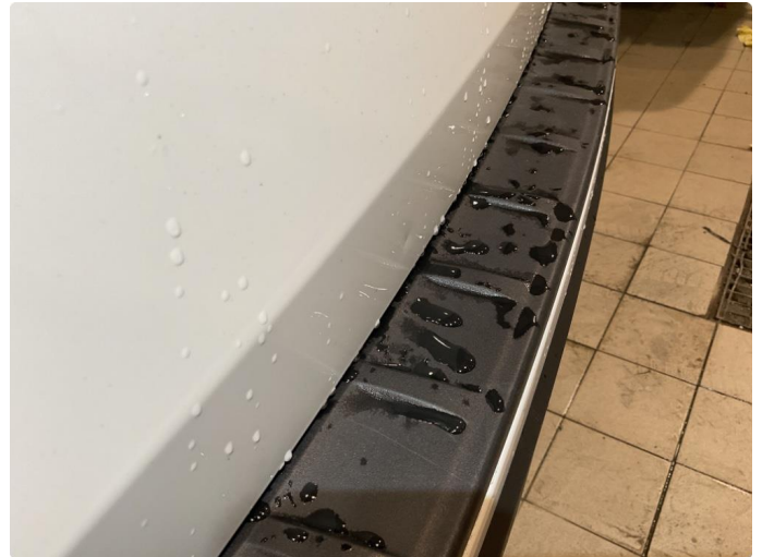
1.2 Bulk - Liten parkeringsbulk