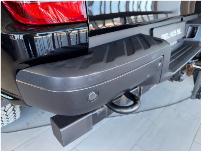
1.1 Noe sår/riper rundt om på bilen. Bedre enn forventet til år/km.