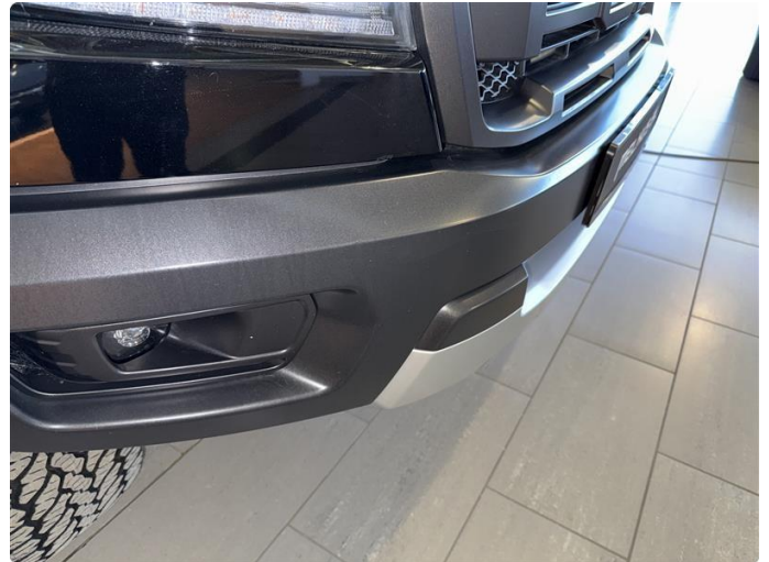
1.1 Noe sår/riper rundt om på bilen. Bedre enn forventet til år/km.