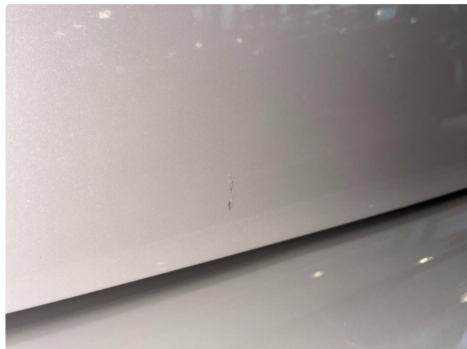
1.2 Ripe/sår på bakluke. Flekkes i før videresalg.