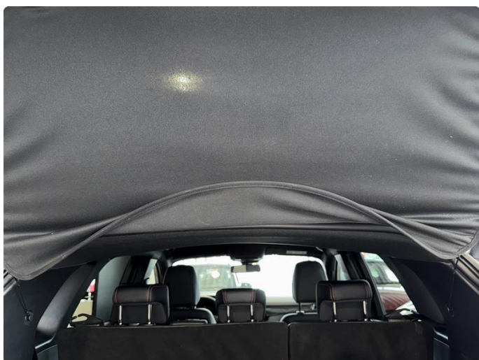
2.1 Bagasjeroms skjuler bøyd.