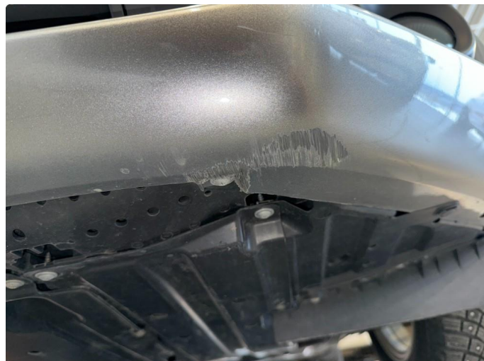
1.2 Sår/riper vsf under front fanger