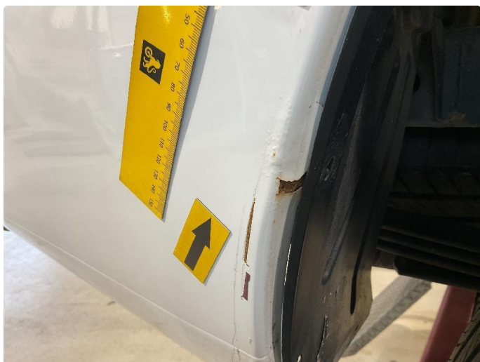
1.5 Riper ned til grunning, slipes ned og flekkes med lakkstift.