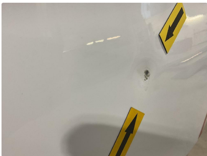
1.4 Bulker, sår/riper på bakfanger. Flekkes med lakkstift