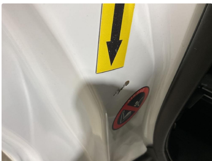
1.6 Bulk med lakkskade, slipes ned og flekkes med lakkstift