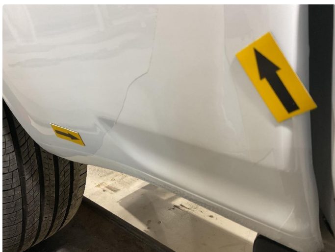
1.3 Flassing av klarlakk