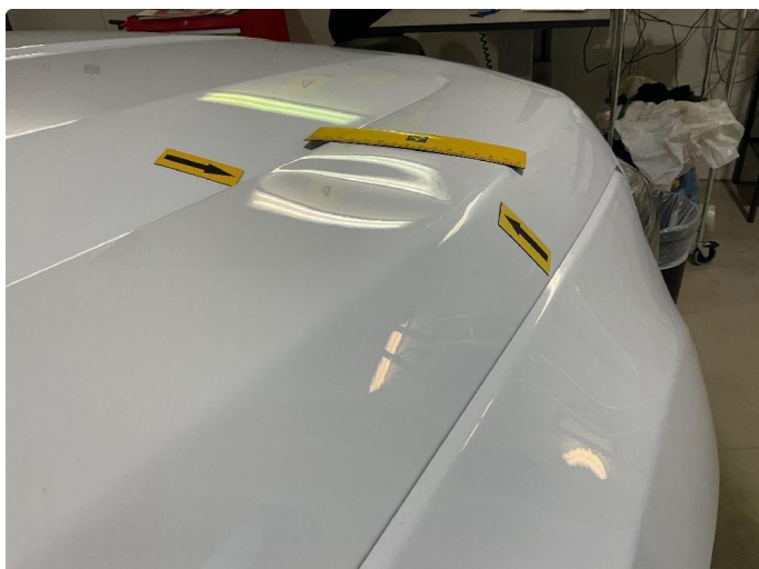
1.2 Bulk panser