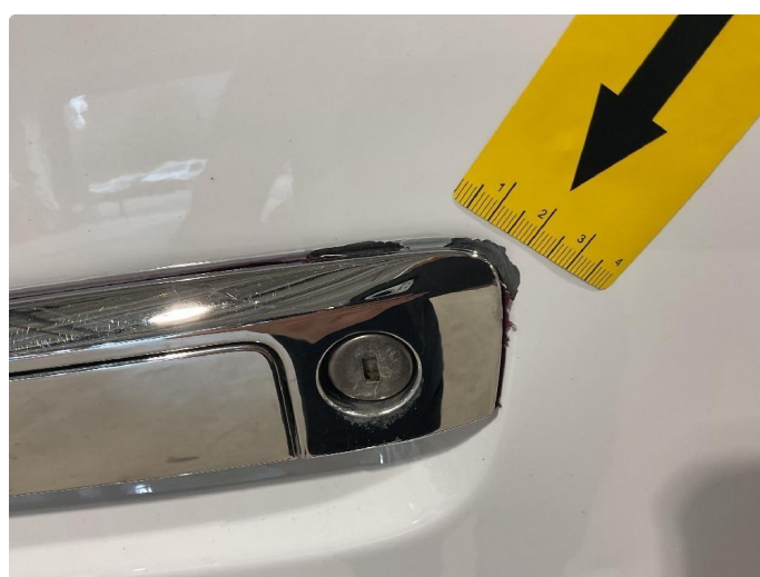
1.4 Bulker, sår/riper på bakfanger. Flekkes med lakkstift