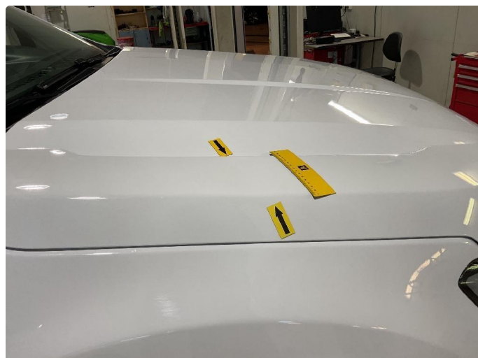
1.2 Bulk panser