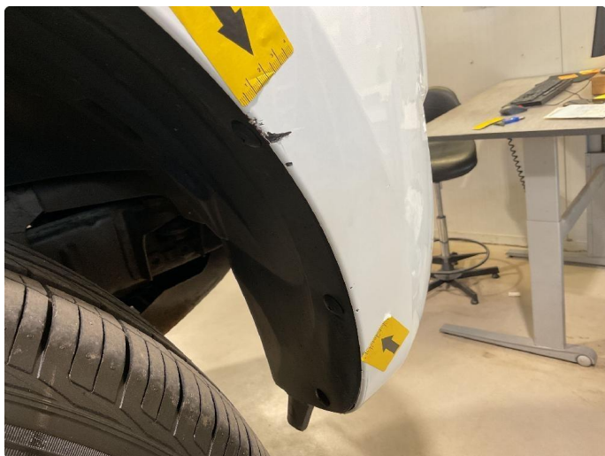
1.7 Sår/riper front fanger