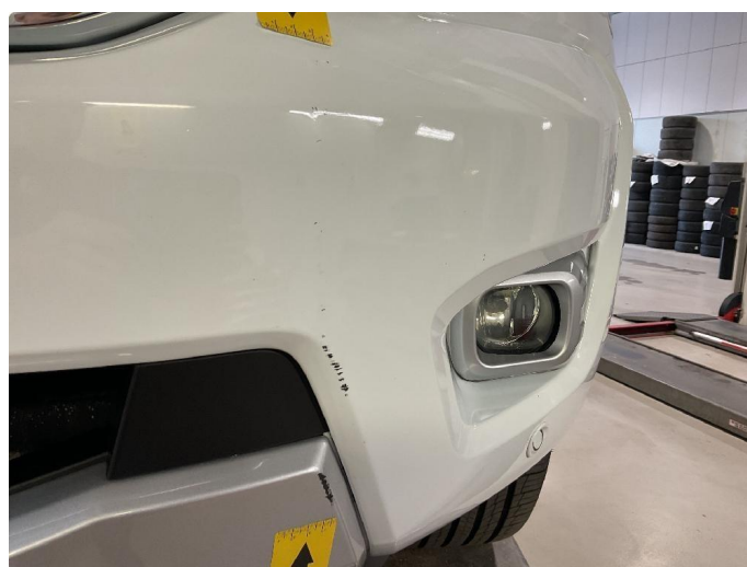
1.7 Sår/riper front fanger