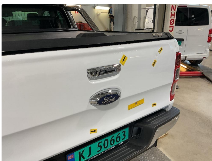
1.4 Bulker, sår/riper på bakfanger. Flekkes med lakkstift