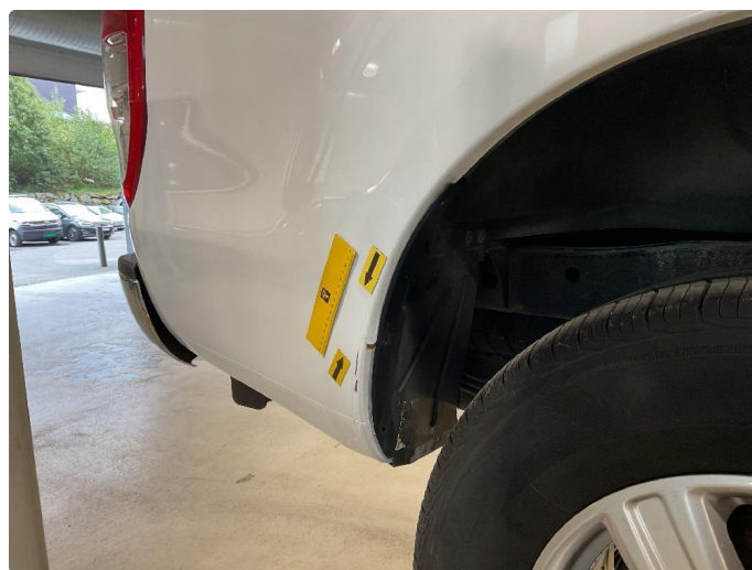
1.5 Riper ned til grunning, slipes ned og flekkes med lakkstift.