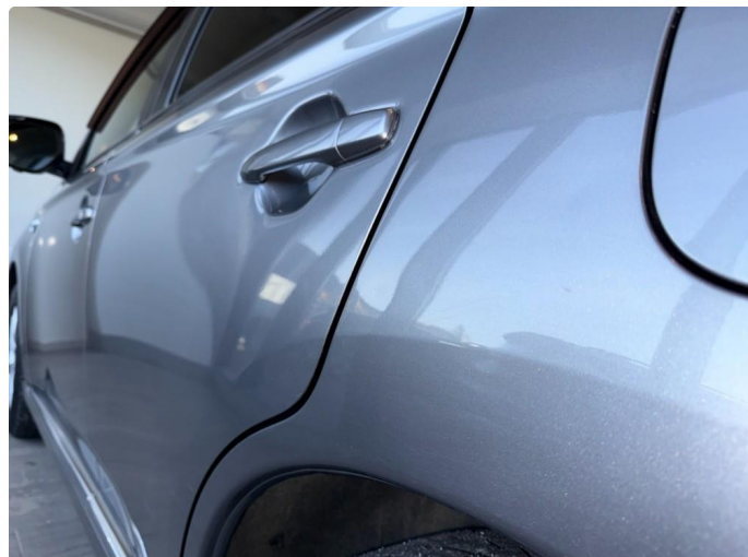
1.1 Noen mindre p bulker, vanskelig å avbilde.