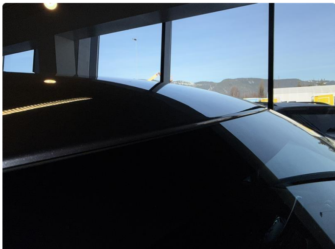
1.1 Noen mindre p bulker, vanskelig å avbilde.