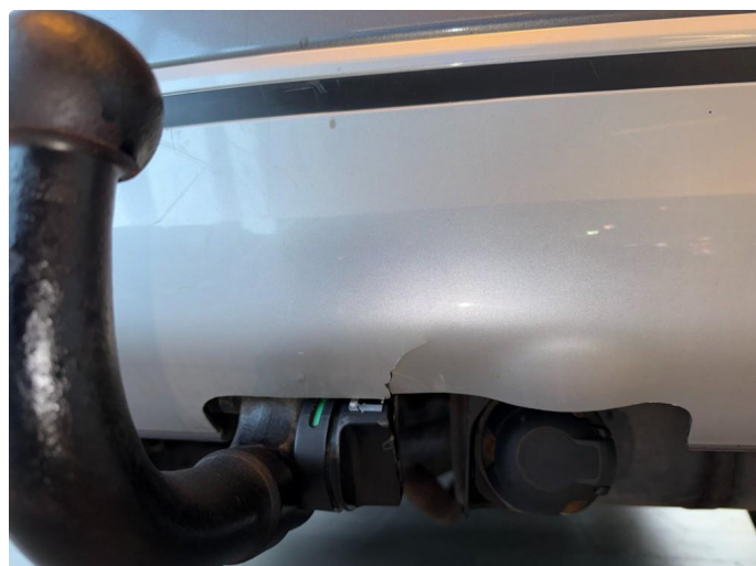
1.2 Sprekk i støtfanger bak.