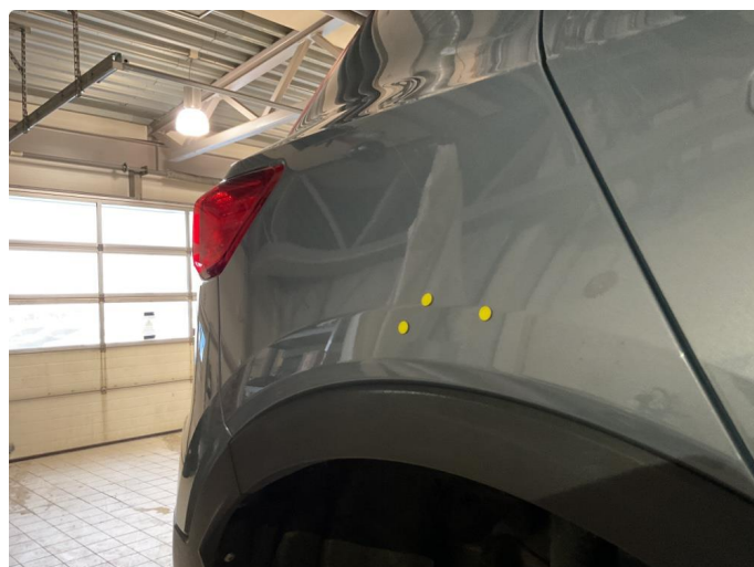
1.3 3 mindre p bulker på vsb