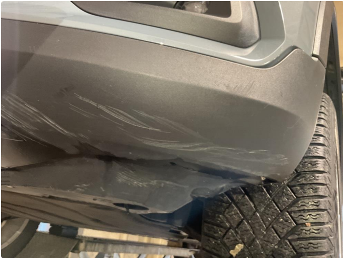
1.5 Noe skrubbskader underkant