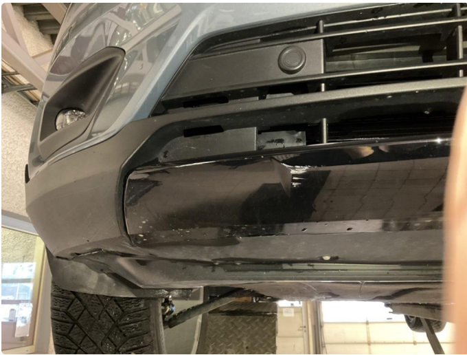
1.5 Noe skrubbskader underkant