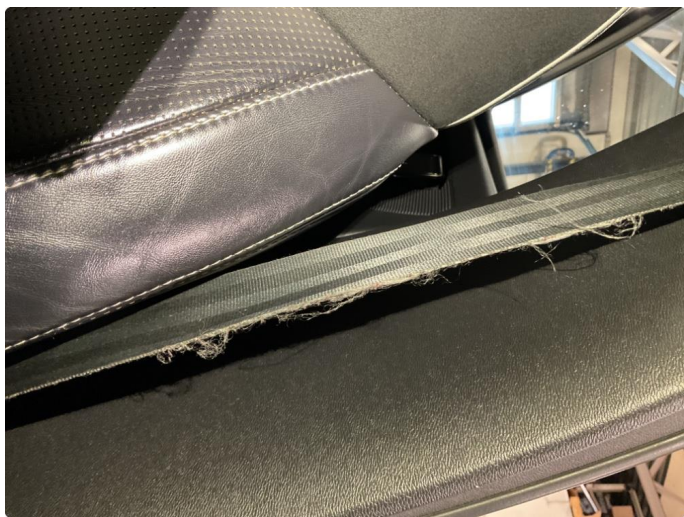
2.2 Noe slitasje på setebelte.