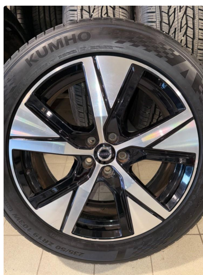
1.4 2 felger kantkjørt