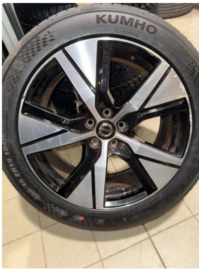
1.4 2 felger kantkjørt