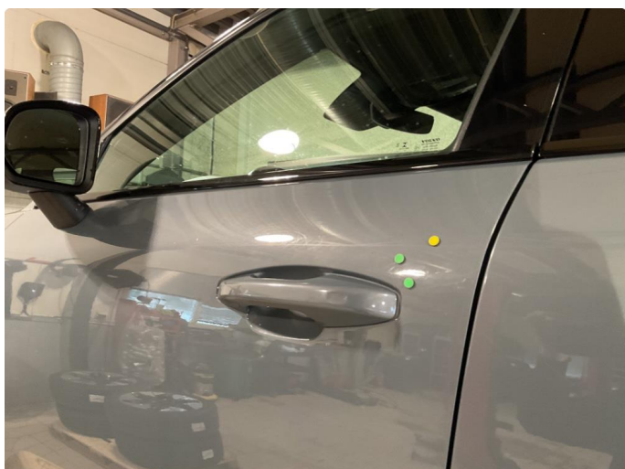
1.2 2 små p bulker på hsf