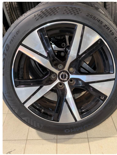
1.4 2 felger kantkjørt