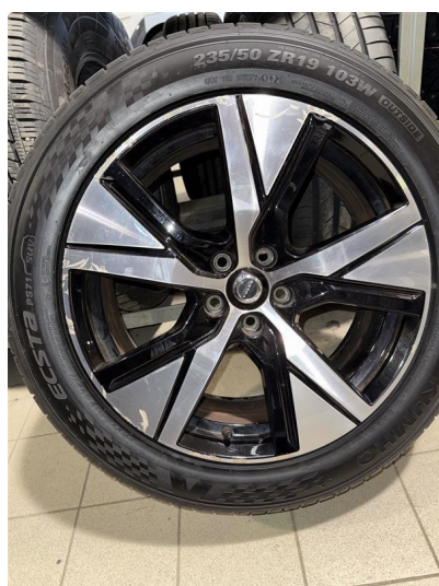
1.4 2 felger kantkjørt