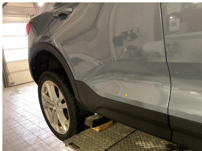
1.1 En mindre p bulk på vsf.