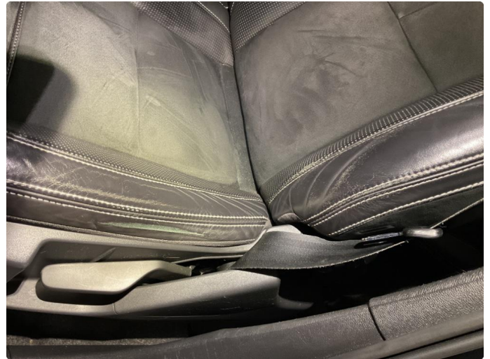
2.1 Noe slitasje på fører sete.