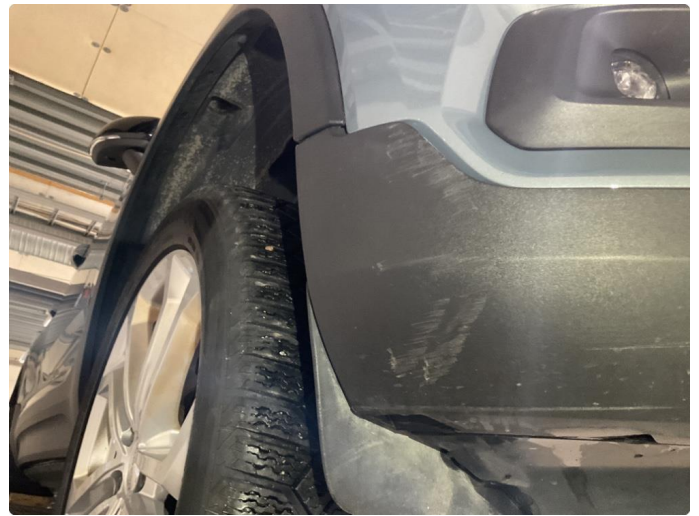
1.5 Noe skrubbskader underkant