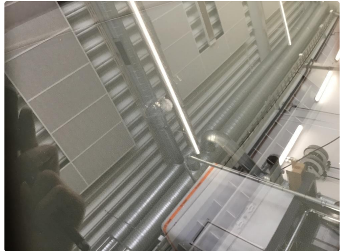
1.2 Liten steinsprut,