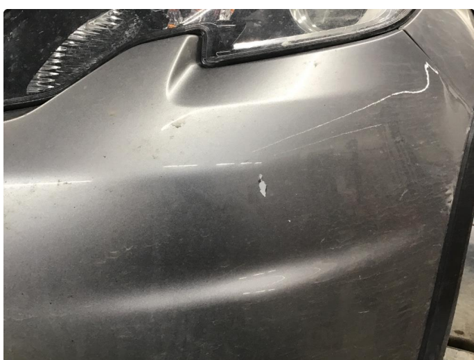
1.4 Lakk flasser