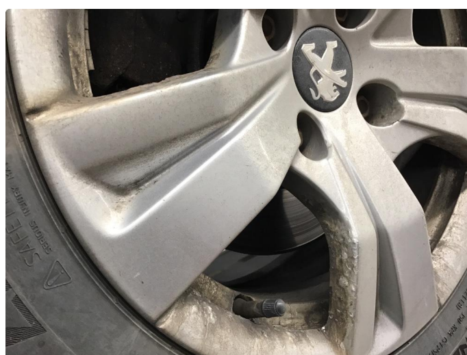
2.1 Korrosjon felger.