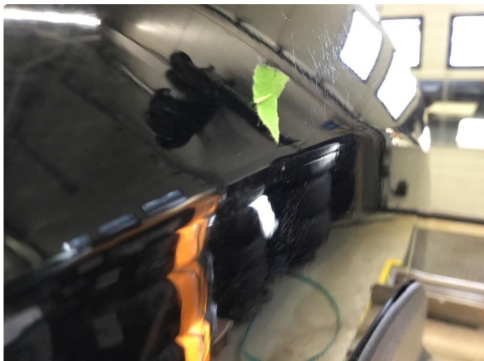
1.1 Liten p-bulk midt på hjulbue v.bakskjerm.