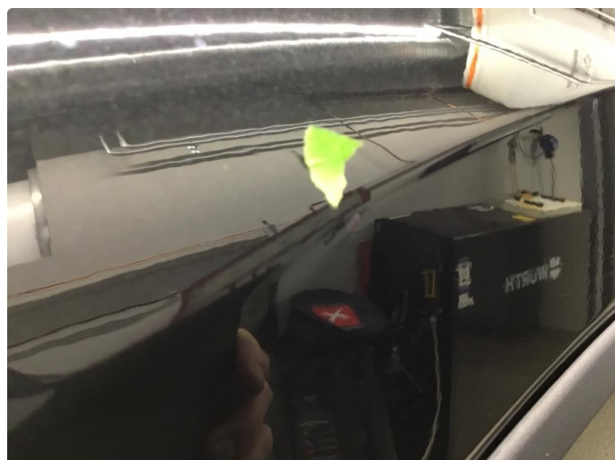
1.2 Veldig liten p-bulk h.forskjerm.