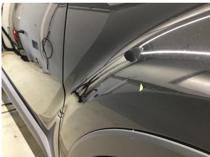
1.2 Veldig liten p-bulk h.forskjerm.