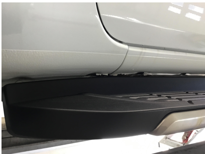
1.1 Noe lakkflassing framkant og midt på kanaler begge sider.