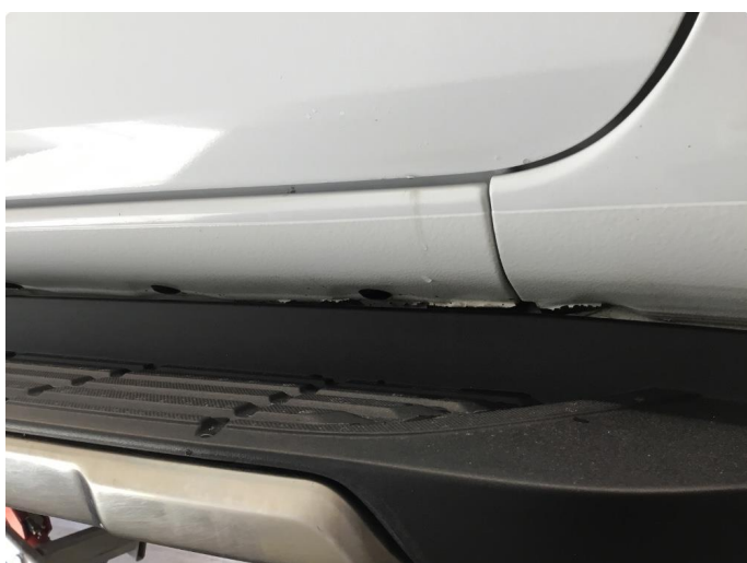
1.1 Noe lakkflassing framkant og midt på kanaler begge sider.