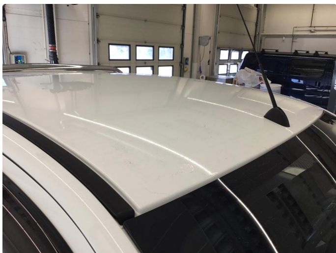
1.6 Noe steinsprut framkant tak. Penselflekket.