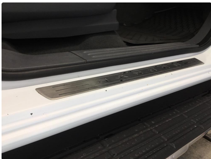
1.4 Lakkslitasje/hakk i lakken terskler.