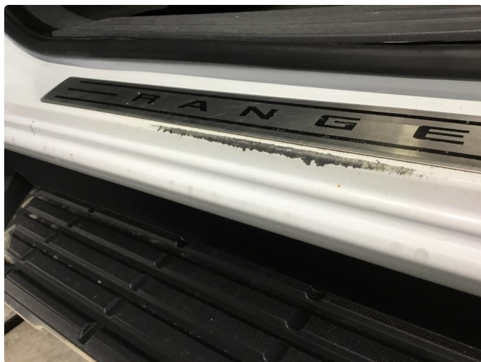
1.4 Lakkslitasje/hakk i lakken terskler.