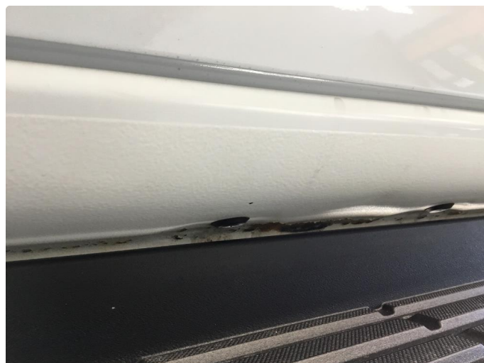
1.1 Noe lakkflassing framkant og midt på kanaler begge sider.