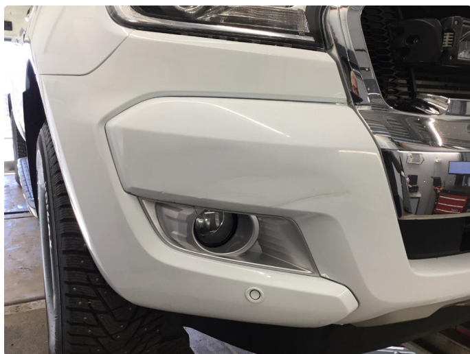
1.5 Noe skrapeskader høyre fangerhjørne foran. Penselflekket.