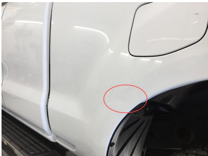
1.3 P-bulk uten lakkskade v.bakskjerm. (Framkant hjulbue)