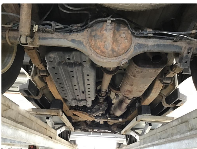
1.2 Noe utenpårust ramme/aksler/normal bruksslitasje.