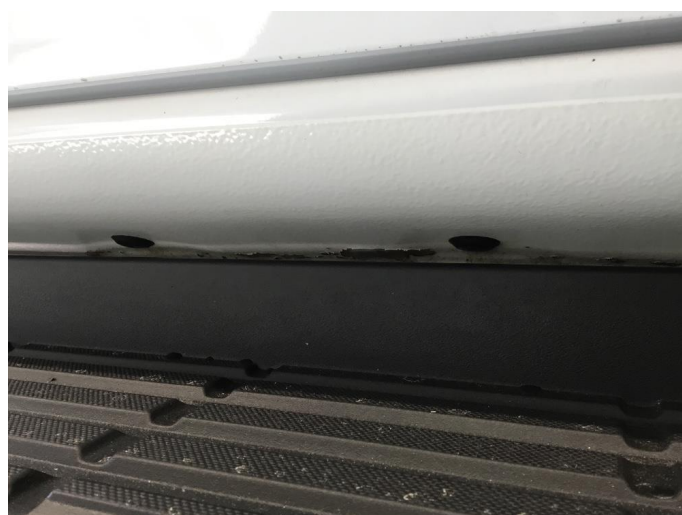
1.1 Noe lakkflassing framkant og midt på kanaler begge sider.