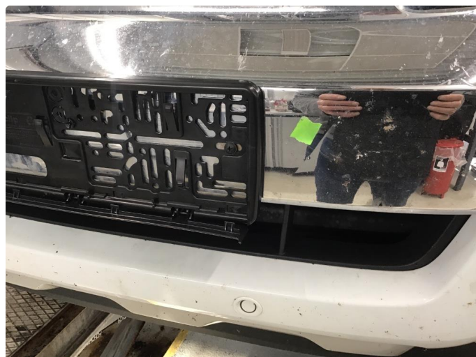
1.2 Klemskade/merke i chrome ved siden av skilt fanger foran.